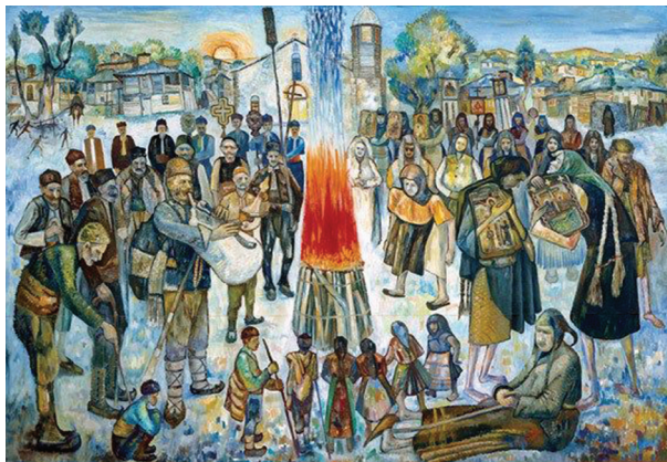
худ. Златю Бояджиев

Това е един много силен празник, който поради извънцърковната си форма не беше засегнат в годините на задължителната атеизация, а продължи без прекъсване да се празнува в семейна среда. Поразителен е размерът на причастността към тайнството Покаяние в тази негова битовизирана форма у българите – народ, който сам себе си определя като безбожен. Наистина за степента на религиозност би трябвало да се съди по делата, които са подчинени на една покаяйна дисциплина, надхвърлила контрола на Църквата и поверила греха и грешките на самоконтрола на