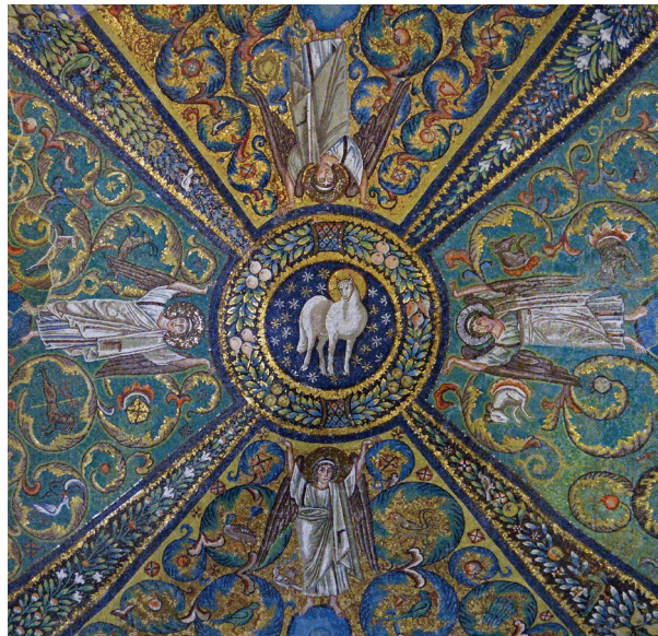
Детайл от мозайката „Агнец Божий“ (ок. 547 г.) в базиликата Сан Витале, Равена, Италия.

на синовете Божии – хората, но и на всички създания, които са свързани в своето бипие, съществуване и осъществяване със съдбата на човека. Както чрез падението на човека те са се покорили на предизвиканието от неговия грях – суета и тление, така и чрез неговото изкупление и прославяне те ще се освободят от робството на суетата и тлението. Свещеното Писание изрично свидетелства, че възлюбеният се Бог Слово е Спасител не само на човешкия род, а и на целия свят – σολῆτροῦ τοῦ κόσμου (Иоан 4:42; 1 Иоан 4:14). Той е изпратен в света – κόσμος (Иоан 3:17; ср. 10:36; 17:18; 1 Иоан 4:9), понеже Бог обикна света – κόσμος (Иоан 3:16) 6 .